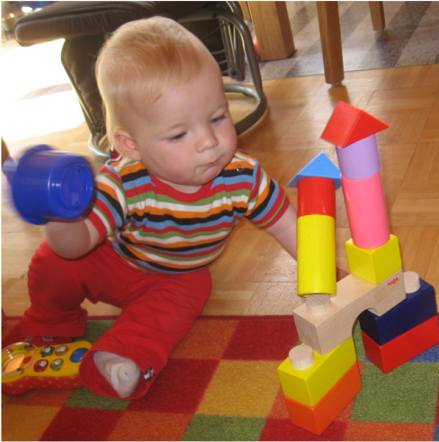
... Türme umwerfen