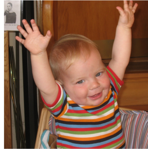
... zeigen wie groß ich bin