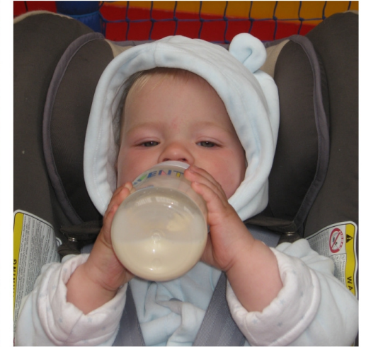
... meine Flasche halten