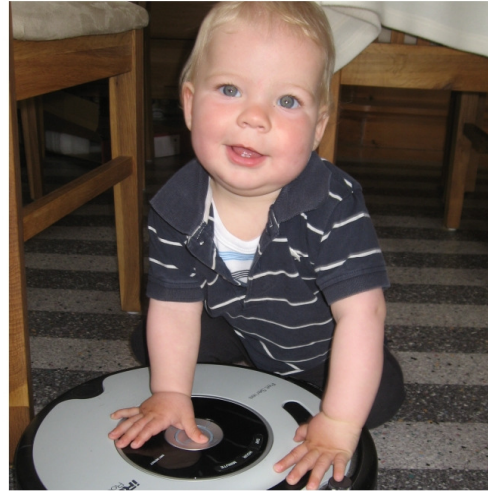
... Robbi anschalten