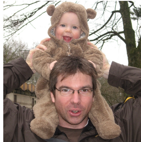
... auf Papa reiten