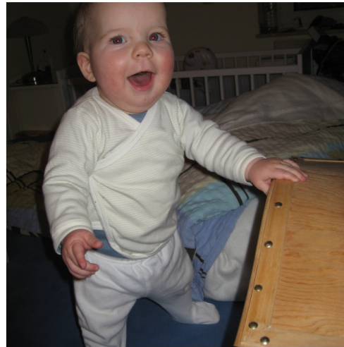
...hochziehen, stehen, strahlen