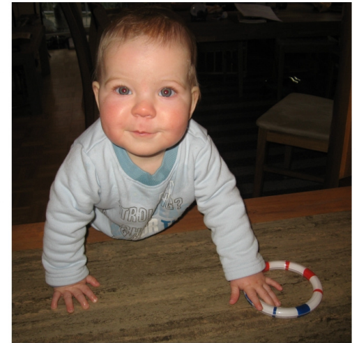
... einhändig Treppe krabbeln