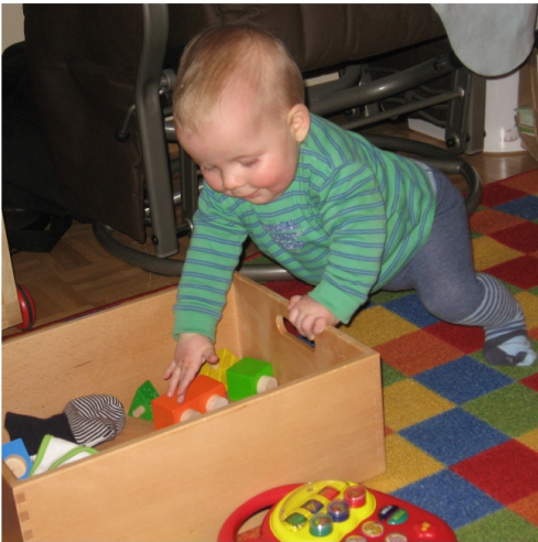
... spielen :-)